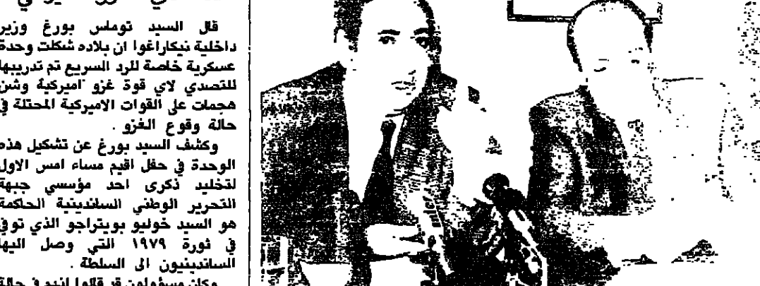
غول الى جانب رئيس حزب الاحرار لويس ميشال يعان الانسحاب من الحكومة

قال الملك بودوان ملك بلجيكا امس ان استقالة الحكومة في اطار انتخابات مبكرة.